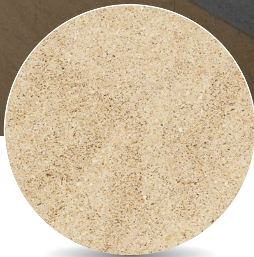
NIWALA YELLOW ARENISCA / SANDSTONE